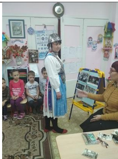
5. Экскурсия в национальную библиотеку