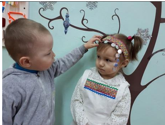
Фестиваль в библиотеке «Зимняя сказка»